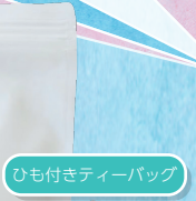
ひも付きティーバッグ