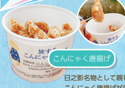
ごんにゃく唐揚げ